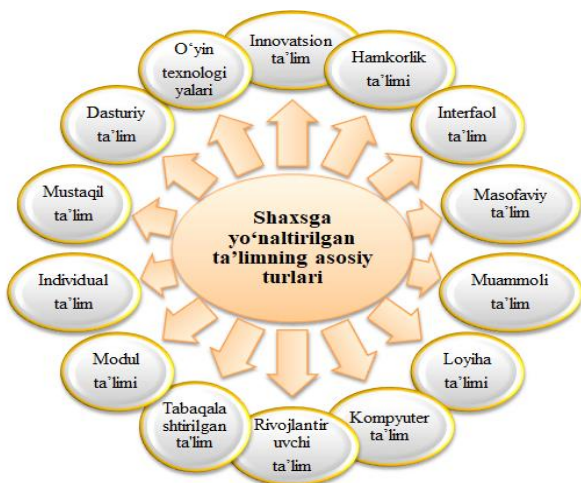
1-rasm. Shaxsga yo'naltirilgan ta'limning asosiy turlari

Maktab geografiyasining shaxsni rivojlantirishga qo'shadigan asosiy hissasi o'quvchilarda geografik madaniyatni rivojlantirish bilan bog'langan. Geografik madaniyatni rivojlantirishning dastlabki bosqichi o'quvchilar tomonidan maktab tabiiy geografiyasini o'rganish hisoblanadi.