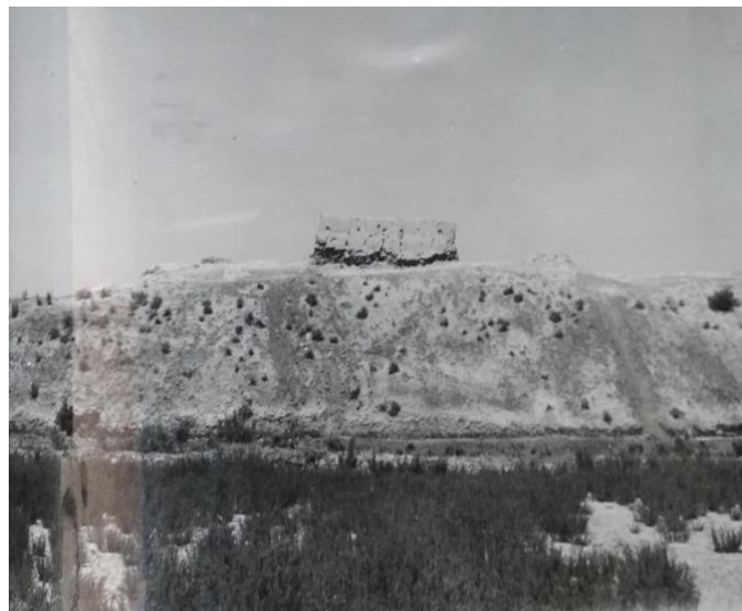
1-расм Чап қирғоқ Кат қалъа. XIX аср мудофаа деворининг қолдиғи. Жанубий девор. (Д.Чунихин, 1987 й.)

Чап қирғоқ Кат қалъанинг XVII-XIX асрларга тегишли мудофаа тизими асосан, 1987 йилда Д.Чунихин томонидан кенгрок тадқиқ қилинган. Мудофаа деворининг жануби-шарқий ва жануби-ғарбий бурчакларида, шимолий, шарқий ва ғарбий деворларида тадқиқотлар олиб борилган бўлиб, энг қадимги мудофаа тизими билан биргаликда шаҳарнинг энг сўнгги даврига оид мудофаа тизими ҳам ўрганилган. Ушбу тадқиқотлар натижаларига кўра, шаҳарнинг шимолий девори узунлиги 290 м, жанубий – 285 м, шарқий – 270 м ва ғарбий қисми 310 м ни ташкил этди, шаҳарнинг умумий майдони эса 9,5 га. [6, с.63,153-154; 9, с. 13-22; 10, с. 21-27].