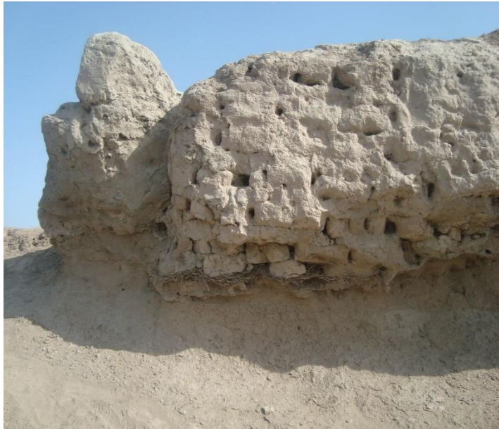
2-расм Чап қирғоқ Кат қалъа. XIX аср мудофаа деворининг қолдиғи. Жанубий девор. Ҳозирги кун

Мудофаа девори. Ҳозирги кунда асосан жанубий деворда XVIII–XIX асрларга тегишли деворнинг пойдевор қолдиқлари сақланиб қолган. Пойдевор пахсадан тикланган бўлиб, асоси майда шох-шаббалардан иборат таглик устига қурилган (2-расм).