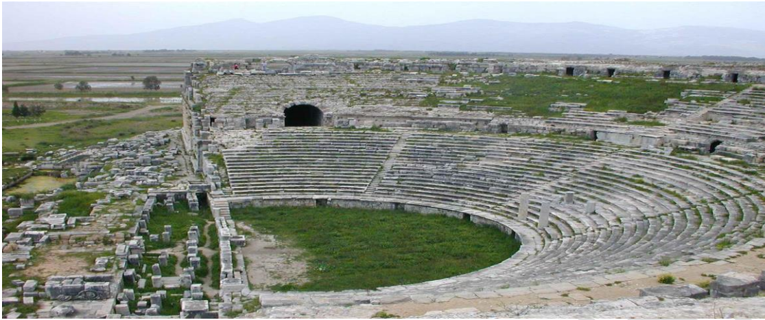
2-rasm. Qadimgi Karfagen shahrida qurilgan amfiteatr

Bu xarobalarning eng qiziqarlisi Rim amfiteatri hisoblanadi. Bu mahobatli beshinchi darajali bino besh ming tomoshabinni sig'dira olgan.